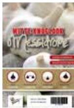
Winter plant- knoflook Messidrome 5 stuks € 4,45

Japanse platte gele ui, met een hoge opbrengst