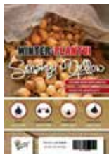
Winter plant- uien Senshyu yellow 250gr € 1,25

Knoflook vraagt een luchtige en humusrijke grond. Het liefst staat ze zongericht. Plant de winterknoflook 10 cm diep in de grond, met de puntige kant naar boven en de wortels naar onder gericht. Laat 10 tot 15 cm afstand tussen de verschillende teentjes en zorg voor een goede 20 cm tussen de planrijen. Knoflook kan wel wat koude verdragen maar tijdens strenge vorstperiodes dek je ze beter af met een vliesdoek of een dikke laag bladeren.