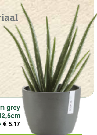
Stockholm grey Ø16cm H12,5cm € 5,75 -10% = € 5,17

Deze kleine bloempot past in elke ruimte met zijn Scandinavisch design