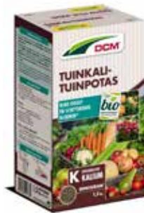
Tuinkali bio DCM 1,5kg € 6,95

Eind juni kan je de eerste knoflookbollen uit de grond halen. Wacht niet te lang met het oogsten want dan kunnen de nieuwe tenen uitlopen. Laat zowel de winterknoflook als de winteruien na het oogsten een dag in de moestuin rusten. Daarna kan je ze in huis ophangen of neerleggen op een droge plek om verder te drogen. Wil jij graag een blikvanger in jouw keuken? Maak dan een spectaculaire vlecht met de knoflookbollen!