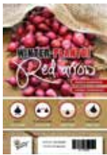
Winter plant- uien Red arrow 250gr € 2,00