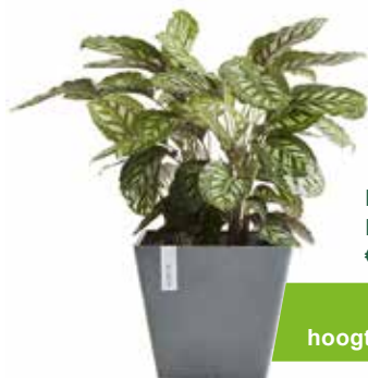
Rotterdam grey LBH: 50x50x43,8cm € 69,95 -10% = € 62,95

Deze kleine bloempot past in elke ruimte met zijn Scandinavisch design