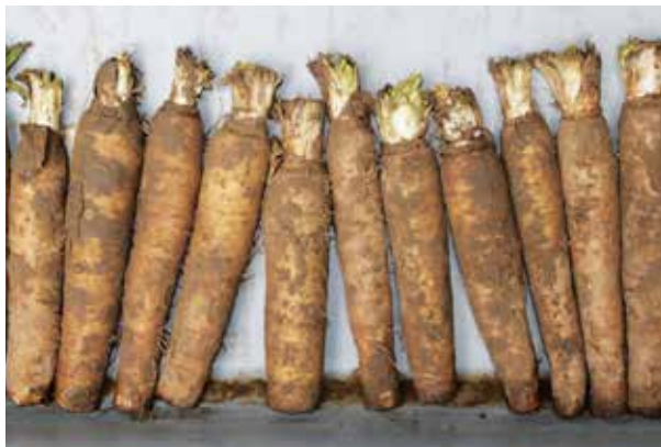
Witloofwortelen 50 stuks (± 8 kg) € 14 per zak, vanaf 2 zakken € 12 per zak.

Stuur dan een mailtje naar info@hermie.com .