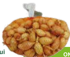
Plantui Sturon 1 kg € 3,95