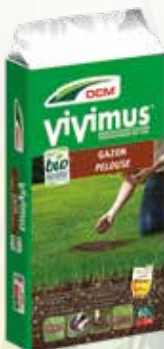
DCM bio Vivimus bodemverbeteraar 60 L Prijns afhankelijk volgens volume

VERBETERT DE BODEMSTRUCTUUR EN BEVordert INWORTLING.