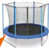
Famijump Basic 183