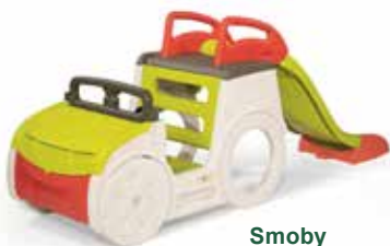
Smoby adventure car met glijbaan € 189,99 -15% = € 161,49

Falk supercharger traptractor met loskoppelbare laadbak € 110,46