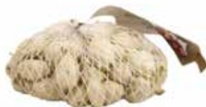
Plantui Snowball 250 gr € 1,75