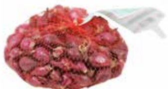
Plantui Red Karmen (rood) 500 gr 14/21 € 2,50