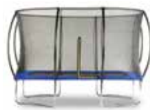
Famijump Premium rectangle 183/274