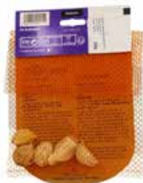
Olifantenknoflook 5 teentjes € 6,95