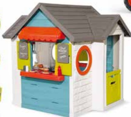
Smoby speelhuis Chef House van € 275,00 naar € 249,00