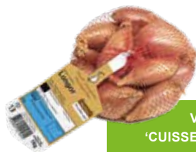
Plantsjalot Longor 1 kg € 6,99