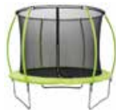
Famijump Premium 305