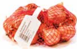
Plantsjalot Red Sun 500 gr € 1,95