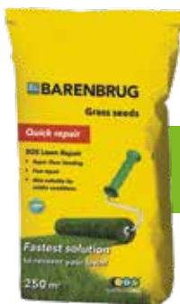
Barenbrug herstelgazon SOS lawn repair 5 kg € 47,65

Bepaalde grasmengsels (zoals Water Saver en Bar Power RPR) zijn samengesteld uit zeer sterke rassen , namelijk Roodzwenk- en Rietzwenkgras. Deze wortelen zich diep in de grond (waardoor ze ook tijdens droge periodes langer gezond blijven) maar dit vraagt tijd . Doordat hun energie naar het inwortelen gaat, kan het makkelijk zes tot acht weken duren voordat je van een groene grasmat kan genieten.