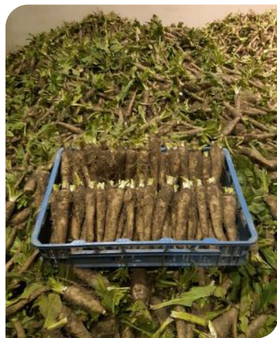
Witloofwortelen vanaf € 13 95 7-9kg