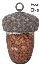
Esschert Design Eikel voederhanger

Doos met 120 mezenbollen in netje € 16 95