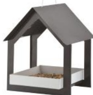
Esschert Design Hangende voedertafel met modern design