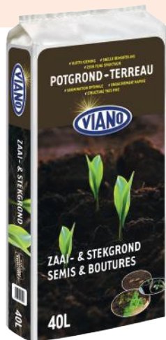
Viano zaai- en stekgrond 40 L