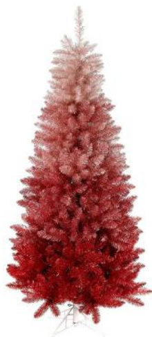
Montreal kunstkerstboom met metalen voet 180 cm: Creëer jouw eigen Winter Wonderland! Of kies voor een flashy exemplaar: de trend van 2021!