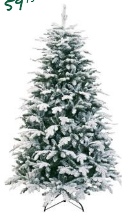
Oslo kunstkerstboom met sneeuw 150 cm: Deze prachtige kunstkerstboom is bedolven onder een donzig laagje sneeuw.