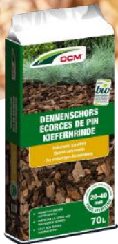
DCM dennenschors 'Pinus sylvestris' 20-40 mm 70 L € 14 95