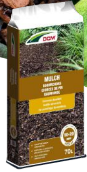
DCM Mulch 10-20 mm 70 L € 14 50

Een bodembedekker is meer dan een mooi sierlaagje in jouw plantenborder of bloembak. Het voorkomt onkruidgroei doordat het de onkruidzaden in de bodem afschermt van het zonlicht. Hierdoor kunnen de zaden niet kiemen, en hoef jij minder te wieden! Bovendien doet een bodembedekker ook dienst als bescherm laag . Zo schermt het jouw planten in de winter af voor de streng vorst . Een bodembedekker houdt echter ook vocht vast waardoor jouw border de droge zomermaanden beter doorkomt.