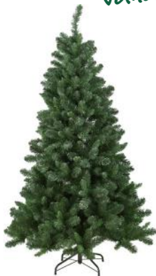
Blackhill kunstkerstboom met metalen voet 150 cm: Het instapmodel voor de kunstkerstboom!