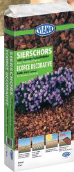
Viano sierschors 'Pinus maritima' 20-40 mm 65 L € 15 99