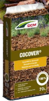
DCM Cocover kokosschors 70 L € 21 50